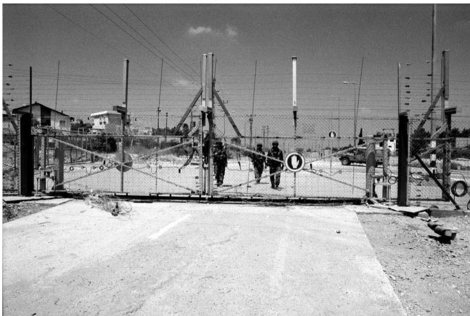
Mas'ha (Cisgiordania), agosto 2004. Muro elettrificato che separa il villaggio palestinese dai territori occupati dai coloni israeliani.