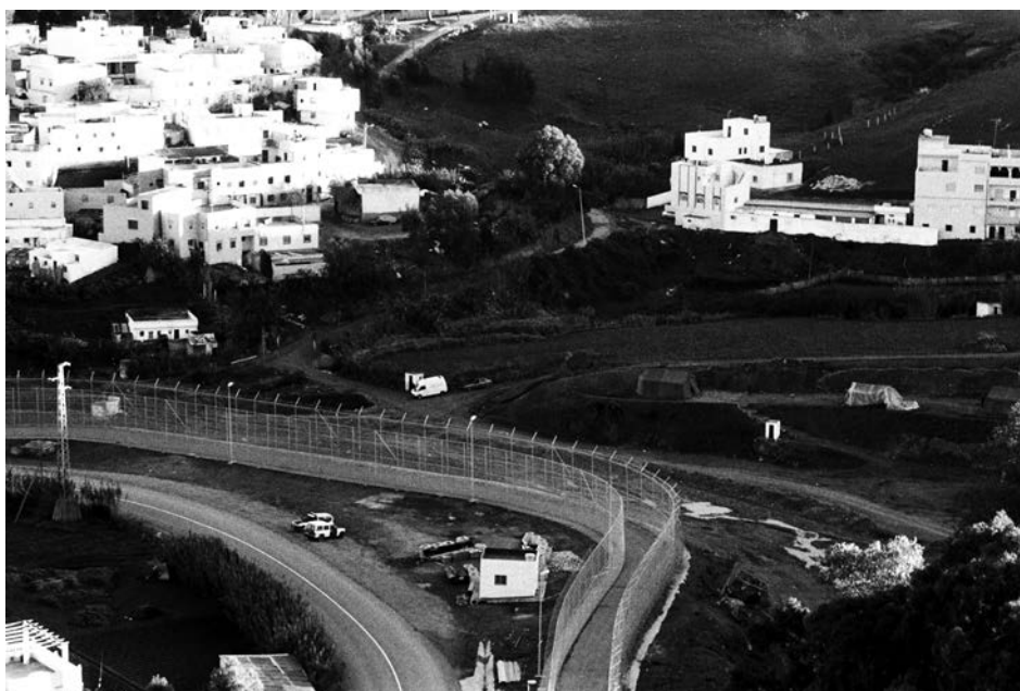
Ceuta (Spagna), dicembre 2005. I villaggi marocchini al di là della barriera.