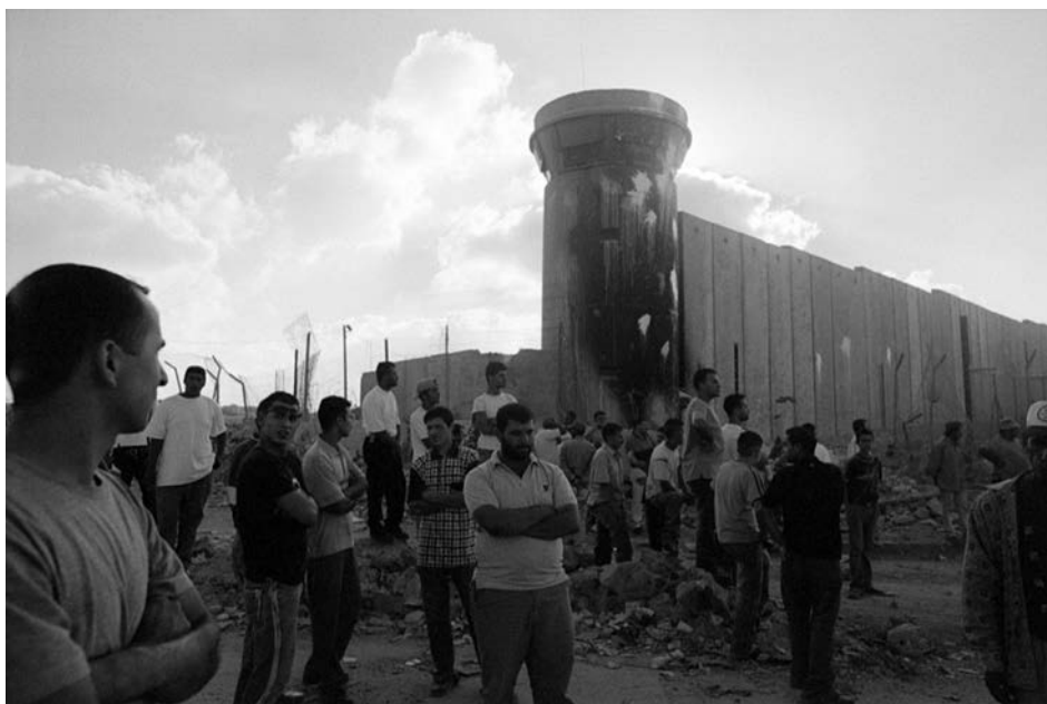
Qalandiya (Cisgiordania), agosto 2004. Muro e torretta in costruzione all'entrata della città di Ramallah.