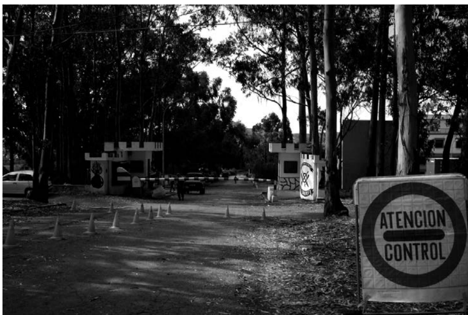
Ceuta (Spagna), dicembre 2005. Centro internamento migranti gestito dall'esercito spagnolo e collegato all'aeroporto per l'espulsione immediata.