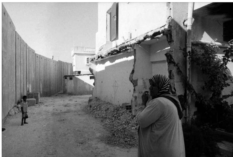
Nazlat Isa (Cisgiordania del nord), agosto 2004. Una casa sventrata dalla costruzione del muro.