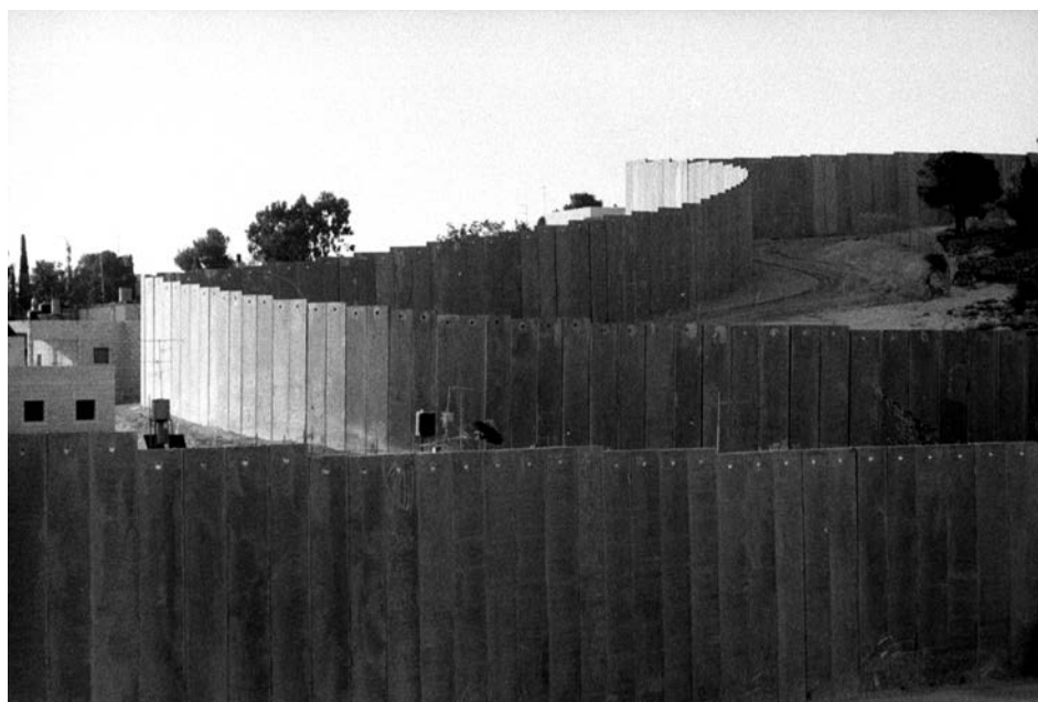
Gerusalemme Est (Cisgiordania), settembre 2005. Il muro corre come un serpente a isolare l'intero quartiere di Abu Dis dal resto della città.