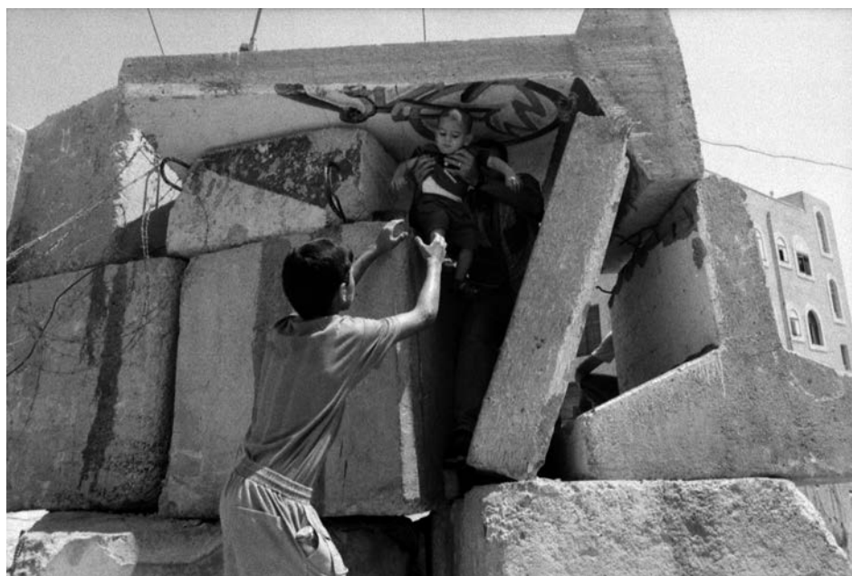
Gerusalemme Est (Cisgiordania), agosto 2003. I primi blocchi per la costruzione del muro provocano notevoli disagi alla popolazione palestinese.