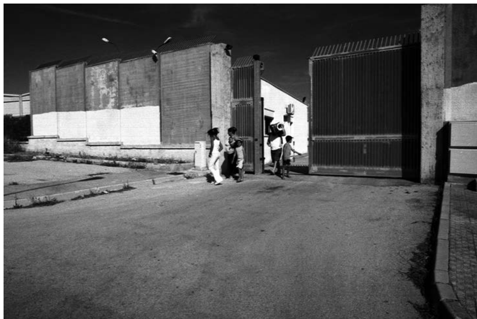
Contrada San Benedetto (Agrigento), giugno 2004. Cannello di entrata al Centro di permanenza temporanea.