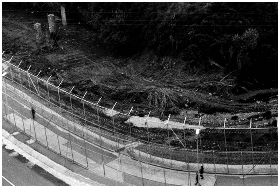
Ceuta (Spagna), dicembre 2005. Barriera lunga 60 chilometri costantemente sorvegliata dall'esercito e da guardie armate che divide l' enclave spagnola dal Marocco.